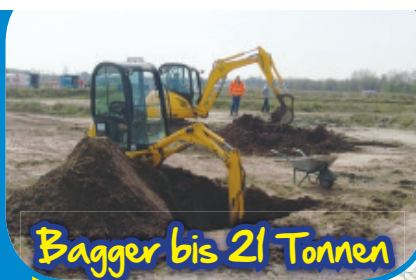
Bagger bis 21 Tonnen

Individuelle Angebote für Kindergeburtstage und Gruppenprogramme auf Anfrage. Info unter: 05932 - 733 89 26