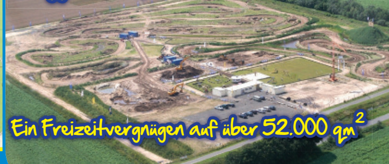
Ein Freizeitvergnügen auf über 52.000 qm 2